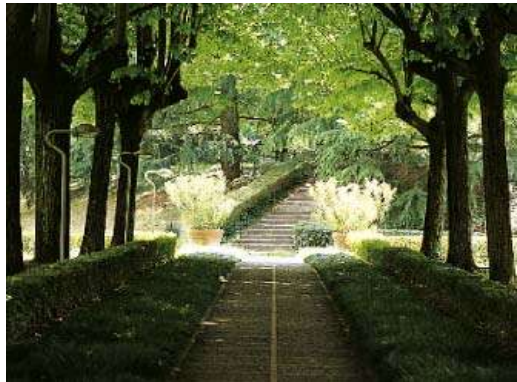
Dettaglio del Parco